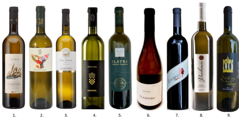
Slika 1. Boce proizvođača žlahtine